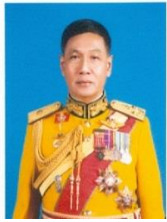
พลเอก ไพชยนต์ คำตัน เจริญ กรรมาธิการ