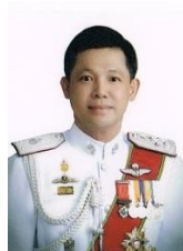
พลตำรวจเอก พงศพัศ พงษ์ เจริญ โฆษกคณะกรรมการ