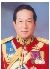
พลเอก อรุณ สมตน์ กรรมาธิการ