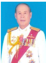
พลตรี จารึก อารีราช การันย์ กรรมการและที่ ปรึกษา