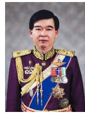
พลเอก อุดลยเดช อินทะ พงษ์ กรรมาธิการ