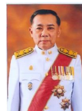
พลตำรวจเอก เอก อังสนานนท์ กรรมาธิการ